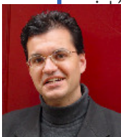
Président Fondateur de la Fête des Voisins

VOISINS SOLIDAIRES accompagne et renforce cet élan au quotidien. Maintenant, c'est toute une dynamique d'entraide, de solidarité qui s'est créée, dans le plaisir partagé, avec légèreté et sincérité. Nous espérons vous apporter de nouvelles idées de voisinage utile, de nouveaux bons côtés d'être à côté !