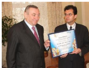
Odessa, avril 2009