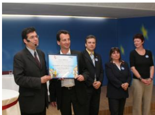
Vienne, mai 2009

Depuis 2004, plus de 80 villes et organisations de logement ont reçu le diplôme « Fête Européenne des Voisins » avec le label «Ville conviviale - Ville solidaire» délivré par le président de la FESP, Atanase PERIFAN, reconnaissant leur implication dans le développement du « mieux vivre ensemble ».